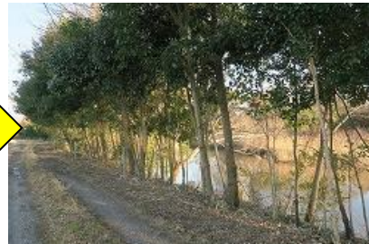
整備された河畔林