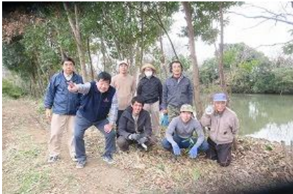
ボランティアの皆様

2021年3月2日、本活動（ふるさとの森を守れ！「松毛川千年の森」再生プロジェクト）が第21回中部の未来創造大賞「大賞」を受賞することが決まりました。皆様のご支援に深謝いたします。