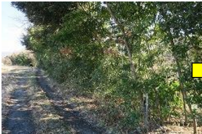
下草が繁茂した河畔林