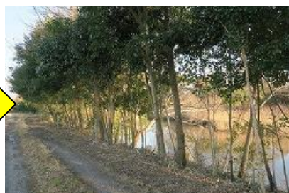
整備された河畔林