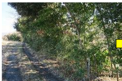
下草が繁茂した河畔林