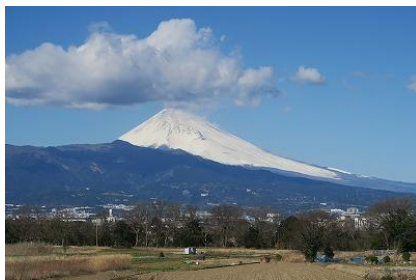
松毛川河畔林と富士山遠景