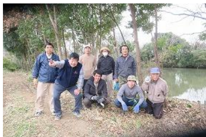
ボランティアの皆様