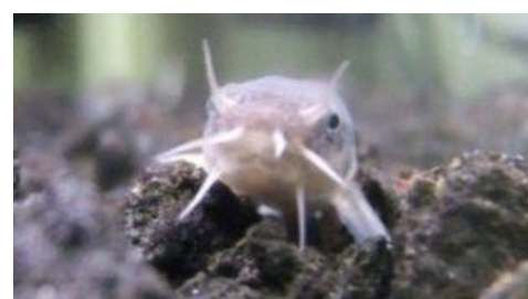
絶滅危惧種ホトケドジョウ