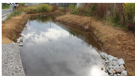
活動場所の自然水路