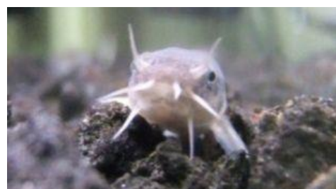
絶滅危惧種ホトケドジョウ