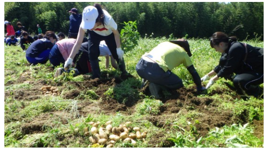
ジャガイモ収穫作業の様子