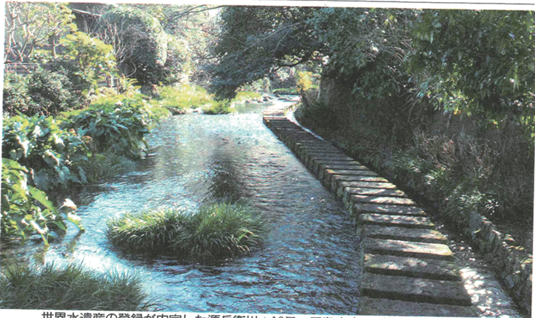
世界水遺産の登録が内定した源兵衛川＝16日、三島市内で