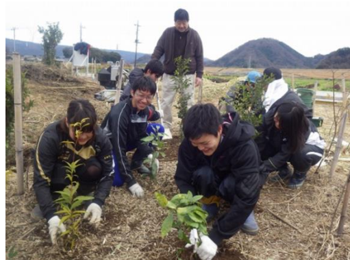
エノキ・ムクノキ等の苗木の植樹

■参加申込書 ⇒ FAX : 055-973-0022 Eメール : info@gwmishima.jp