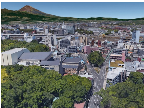
三島市立公園楽寿園正門前（現状）