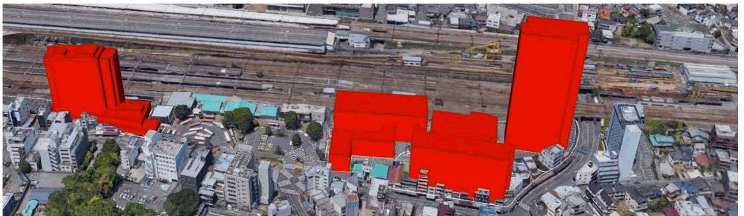
三島駅南口再開発事業・CGイメージ図（模型は事務所に常設展示。見学歓迎）