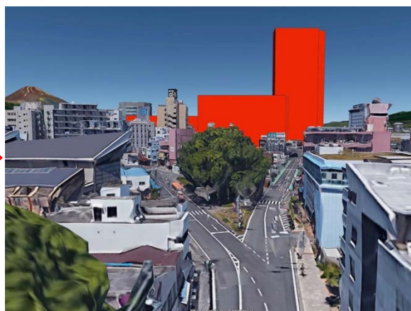
三島市立公園楽寿園正門前（再開発後）