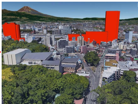
三島市立公園楽寿園正門前（再開発後）