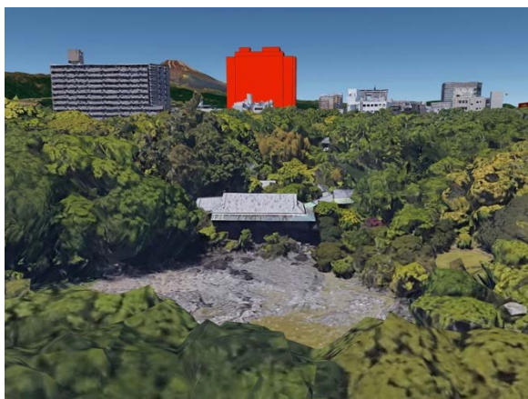
三島市立公園楽寿園