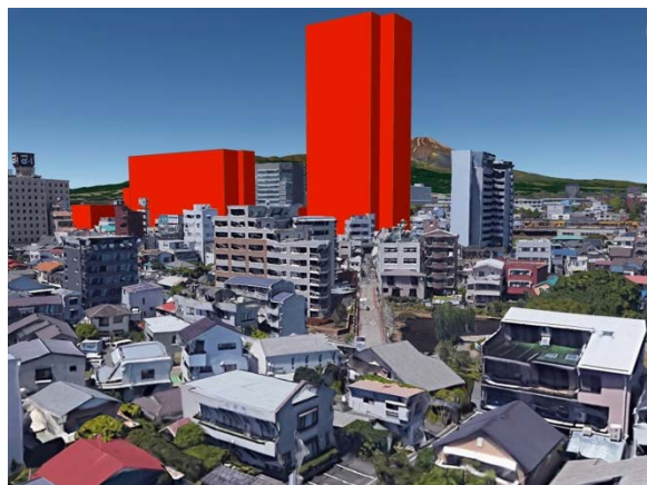
三島市民生涯学習センター駐車場北側付近