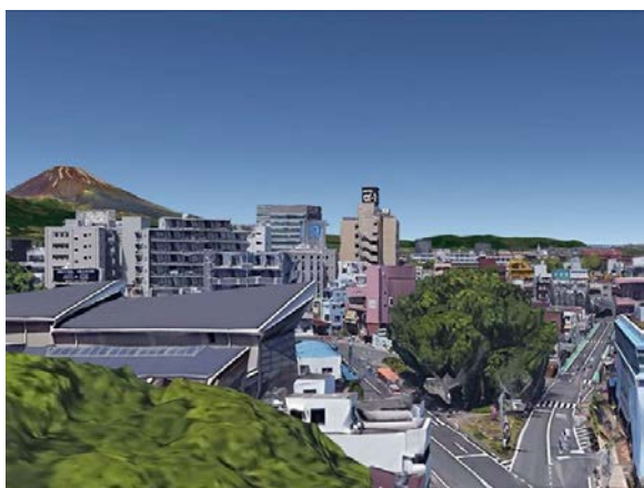
三島市立公園楽寿園正門前（現状）