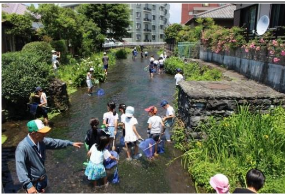
御殿川 (通学橋の上流)