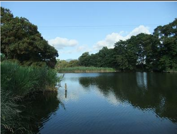
松毛川 (狩野川の原風景の河畔林)

三島市と沼津市の境界に位置する、狩野川旧河川敷の三日月湖・松毛川。両岸には貴重な「ふるさとの森」である河畔林が残っており、この河畔林を買収し次世代に継承するために「松毛川の森を守る募金活動」を行い「千年の森」づくりを提案します。