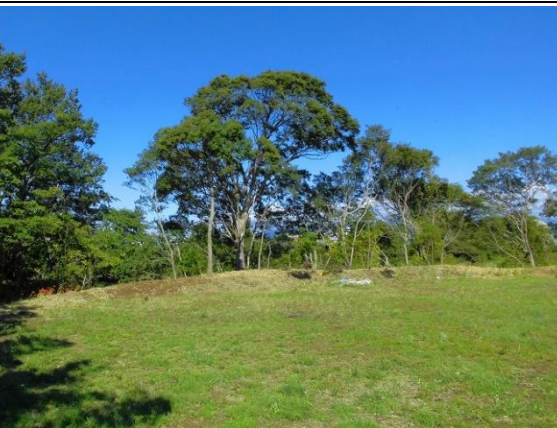
放置竹林伐採後によみがえった河畔林