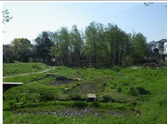
境川・清住緑地 (愛護会が維持管理)

富士山を水源とする湧水地や貴重な自然環境が残る、境川・清住緑地。三島市が買収した養魚場跡地と大湧水池・三つ又、丸池を一体化させて「水の郷・富士山大湧水公園」としての整備と保全を提案します。