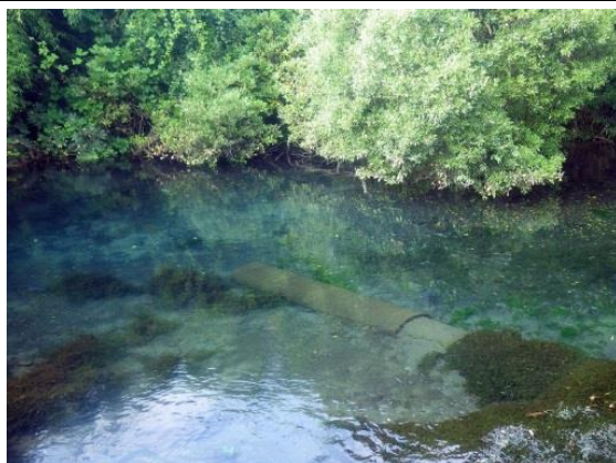
大湧水池・三つ又