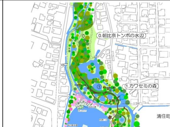
富士山大湧水公園構想図