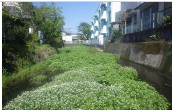
外来植物オランダガラシが繁殖した時の御殿川

新たな「水の都・三島」の集客施設・水辺づくりとなる第2の源兵衛川の創設を目指して、源兵衛川・三島梅花藻の里・佐野美術館隆泉苑・御殿川などの水辺の回遊性を高めた「水の文化散歩道・水と緑のネットワーク」の創出を提案します。