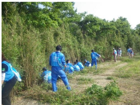
竹伐採・清掃活動