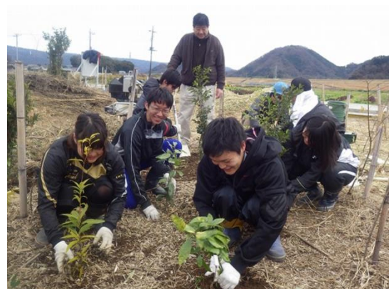
エノキ・ムクノキ等の苗木の植樹