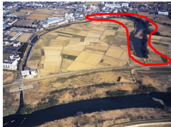
今回の活動（散策）予定地