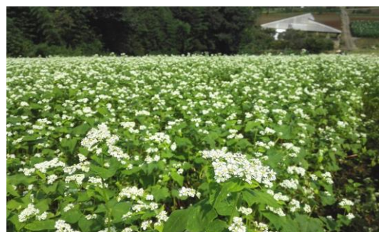
満開のそばの花 (平成 28年 9月下旬)