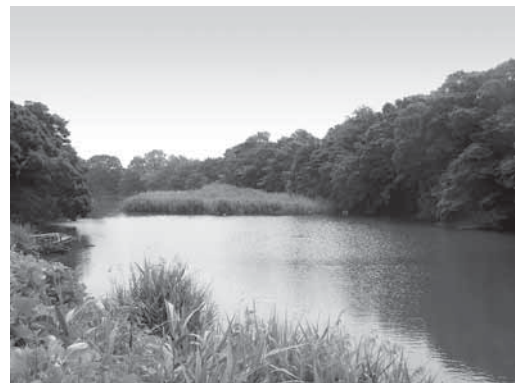
狩野川の原因風景・松毛川の河畔林