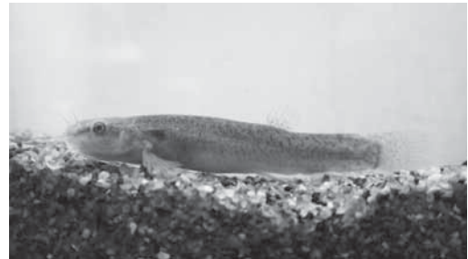
清流のシンボル・ホトケドジョウ