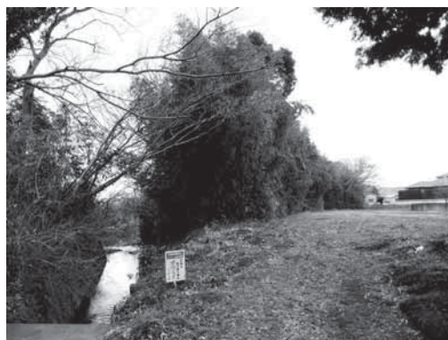
放置竹林で覆われた松毛川中流部