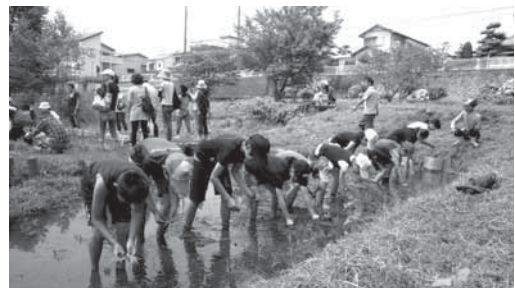
田んぼの楽校（田植え体験）