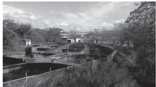
養魚場跡地（境川・清住緑地南隣）

この協力体制の整備を受け、当会では、両エリアと境川右岸に位置する農業用ため池「丸池」を含めた全体約3.0haを、全国に誇る「富士山・境川大湧水公園」とすべく、環境基礎調査やワークショップ、ワンデイチャレンジ等の「エコロジーアップ(生態系の強化)」、子どもから大人までの新たな地域人材の発掘と地域協働による持続的な維持管理体制の構築を進めてきた。