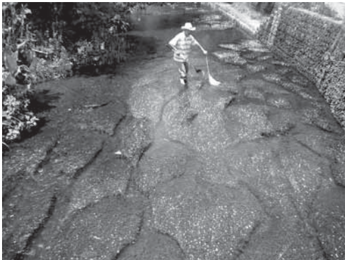
源兵衛川で復活したミシマバイカモ

松毛川は、源兵衛川の最下流域に位置する、狩野川流域に唯一残された6haの止水域である。両岸には、狩野川の原因風景であるエノキ等による1,300本の河畔林が広がり、樹齢100年以上の巨木が130本以上も残存する貴重な旧河川敷である。しかし、土地所有者の高齢化と農地の放棄により、河畔林周辺は繁茂した放置竹林に厚く覆われ、風雨や老齢化による倒木も発生して、大切なふるさとの森が消滅の危機に瀕していた。