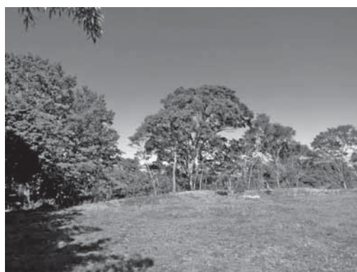
河畔林が復活した松毛川中流部