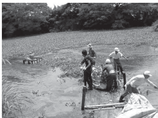
松毛川で大繁殖した外来種ホテイアオイの除去作業

現在、当会の活動が広く広報され、多くの市民が松毛川の存在と川と森の貴重性を認識し始めている。また、3年後に国の治水事業(約5億円)の実施が予定さ