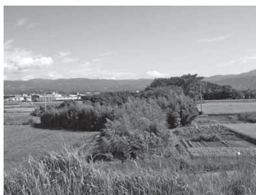
放置竹林で覆われた松毛川最上流部