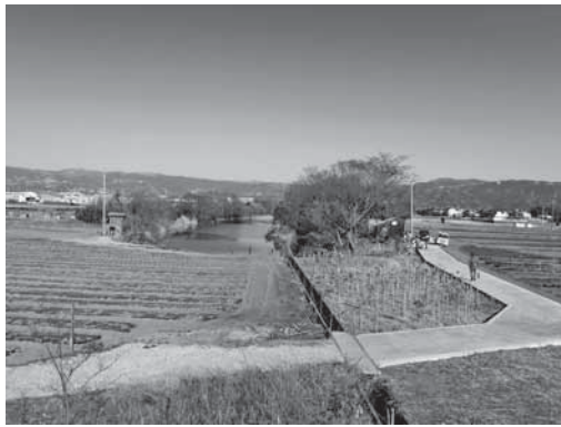
放置竹林伐採後の松毛川最上流部

れ、当会の「千年の森づくりトラスト」運動による河畔林の買収、さらに、三島市による周辺部の買収と親水公園化事業の計画策定等も現実化し始めている。10年以上にわたる、ノコギリとゴミ袋を持った、当会の地道な環境改善活動が、「千年の森づくり」へと力強い道筋を進み始めている。