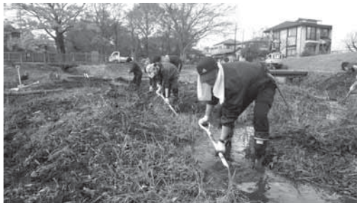
ワンデイチャレンジでの土羽水路づくり

今後は、新たな湧水池との一体的・広域的な川と緑の整備計画の策定を進め、富士山の湧水の美しさや川の多様な魅力を体験・実感できる、「大湧水公園構想」の実現に先導役として取り組んでいく。