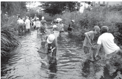
源兵衛川環境出前講座