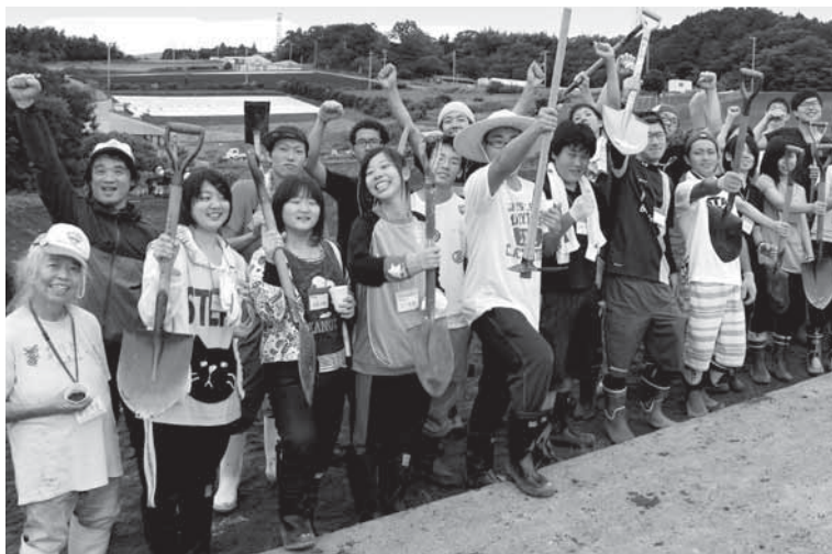
右手にスコップ・左手に缶ビール！

身近な生活環境の中で発生した地域課題に対して、市民自身が傍観者になるのではなく、積極的、具体的な形でその地域課題に取り組み、具体的な小さな成果、実績を残すことにより、市民自身に誇りを取り戻して、街への愛着の気持ちを醸成する「自立と自発への心の変革運動」といえる。「議論よりもアクション」「走りながら考える」が行動指針・規範であり、課題解決に市民が、主体的・自主的に取り組む、現場主義の「大人の学校」づくりに留意している。