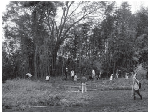
松毛川中流部の放置竹林伐採作業