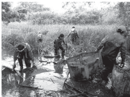
地域住民との協働による松毛川清掃活動