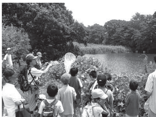
松毛川自然観察会