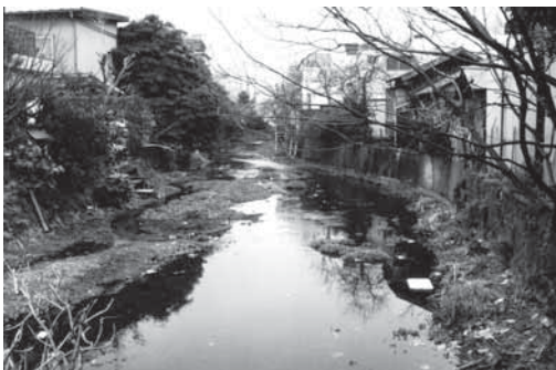
環境悪化が進行した源兵衛川(昭和55年頃)