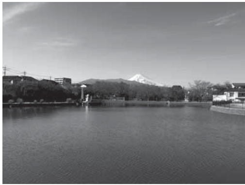
丸池から望む富士山