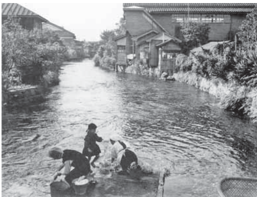
湧水が豊富だった頃の源兵衛川(昭和30年頃)