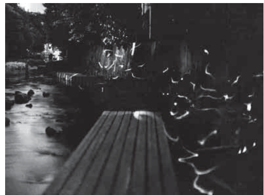
ゲンジボタルが乱舞する源兵衛川