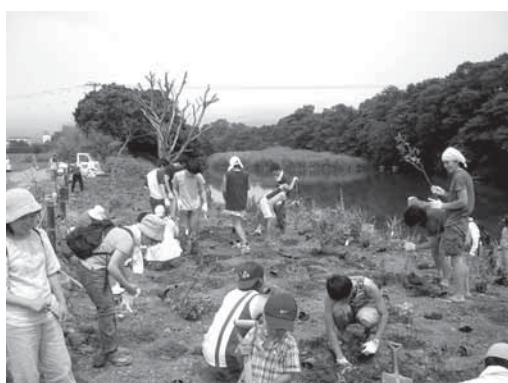
松毛川「千年の森づくり」植樹活動