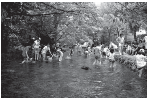
源兵衛川で生き物さがし

そこで当会では、松毛川を「千年の森」と位置付け、平成15年から地域協働による環境改善活動を実施してきた。これまでに河畔1.5kmにも及ぶ竹林伐採や潜在自然植生の苗木4,500本以上の植樹、外来種ホテイアオイの駆逐、2tトラック数十台分以上のゴミの除去、松毛三日月会等地元愛護会の結成、自然観察会の開催、大学生の現場体験や企業のCSR活動の場としての活用、