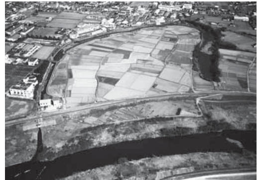
松毛川を空中から望む