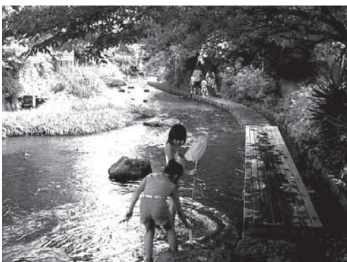
清流がよみがえった源兵衛川