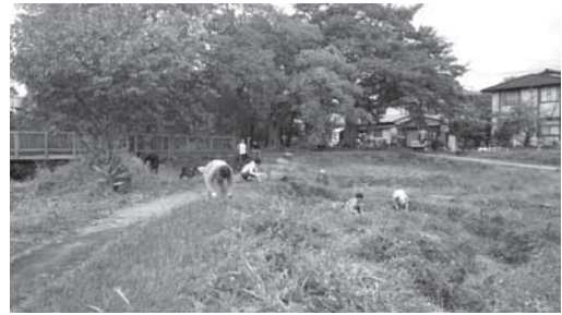
境川・清住緑地愛護会による維持管理活動

跡地約8,000m 2 を含めて大湧水公園として拡大・整備していくことになった。