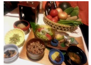
地場食材創作料理

本ミーティングでは、小山町の農村地域資源の再確認と利活用、食育や地域交流などの農地の多面的な利用、地産地消や6次産業化（農商工連携）の体制づくりなどについて、議論・検討します。