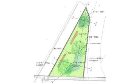
公園の完成イメージ図