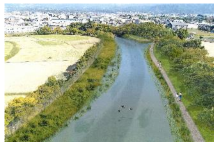
松毛川完成イメージ図