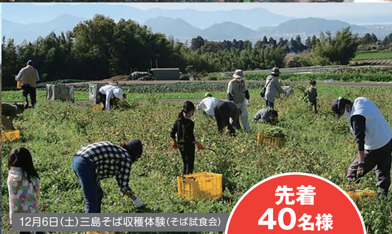
12月6日(土)三島そば収穫体験(そば試食会)