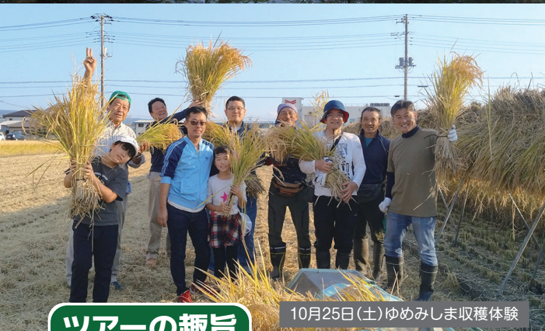
10月25日(土)ゆめみしま収穫体験