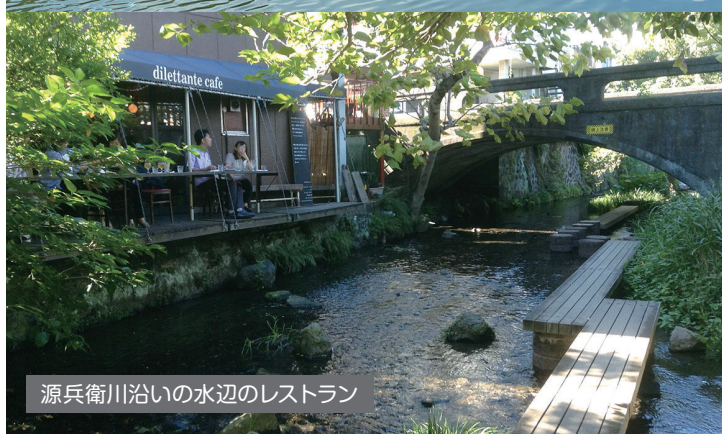
源兵衛川沿いの水辺のレストラン