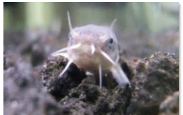
清流のシンボル・ホトケドジョウ