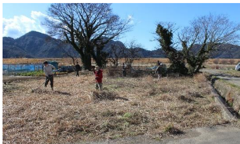
耕作放棄地の草刈り作業