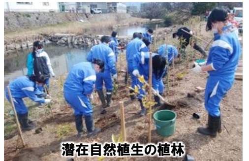
潜在自然植生の植林

しかし過去には、雑排水の流入による富栄養化により、外来植物であるホテイアオイが川面を覆いつくし、生態系に大きなダメージを与えました。また、河畔林の弱体化による倒木やヘドロの堆積、ゴミの放置などの環境悪化も進行しています。