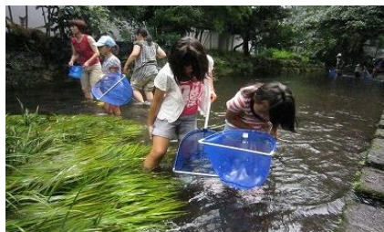
伊豆の自然や三島市の水辺散策、こどもたちの体験学習などのショートツアーです。