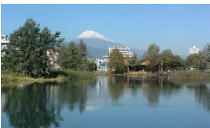
水の都・三島から見える富士山