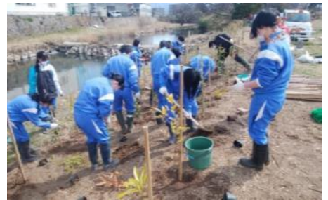
松毛川での植林作業