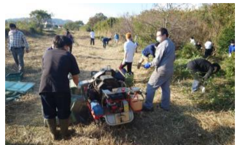
伐採した竹のチップ化作業