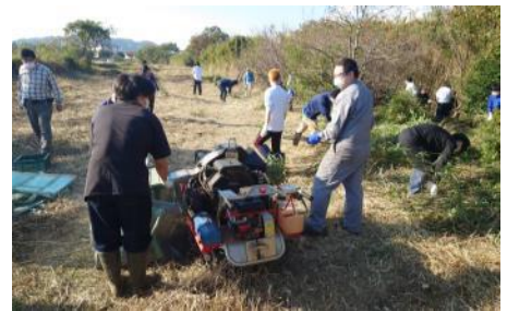
伐採した竹のチップ化作業