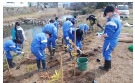
松毛川での植林作業