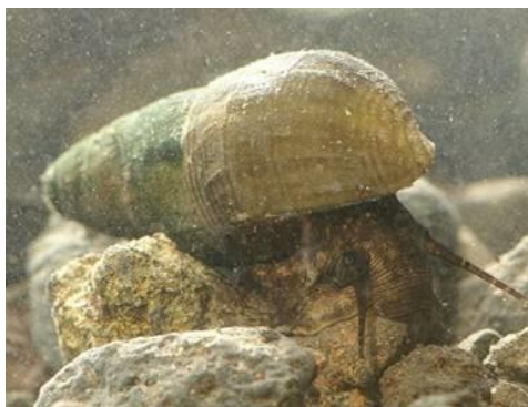
ホタルの餌のカワニナ

三島の「水辺の宝物」である源兵衛川的环境と清流のシンボルであるホタルの「命」を守るホタルの「守り人」の活動に、ご協力をお願いします。