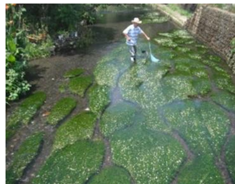
ミシマバイカモの群生地