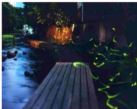
ゲンジボタルの乱舞