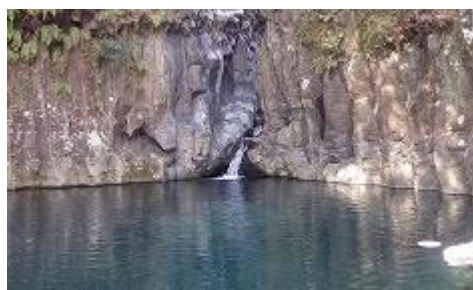
裾野市・景が島溪谷湧水