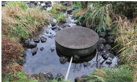
三島市・白滝公園内井戸