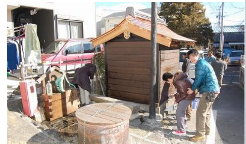
三島市・腰切井戸