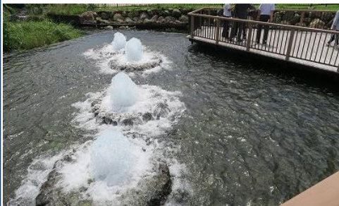
三島市・境川・清住緑地