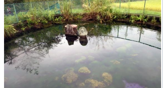
御殿場市・二子湧水