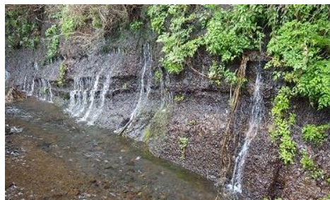
小山町・棚頭湧水