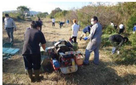
伐採した竹のチップ化作業