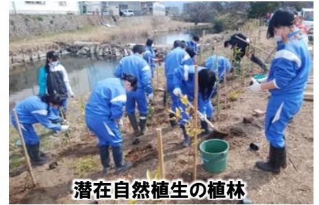
潜在自然植生の植林

しかし過去には、雑排水の流入による富栄養化により、外来植物ホテイアオイが川面を覆いつくし、生態系に大きなダメージを与えました。また、河畔林の弱体化による倒木やヘドロの堆積、ゴミの放置などの環境悪化も進行しています。