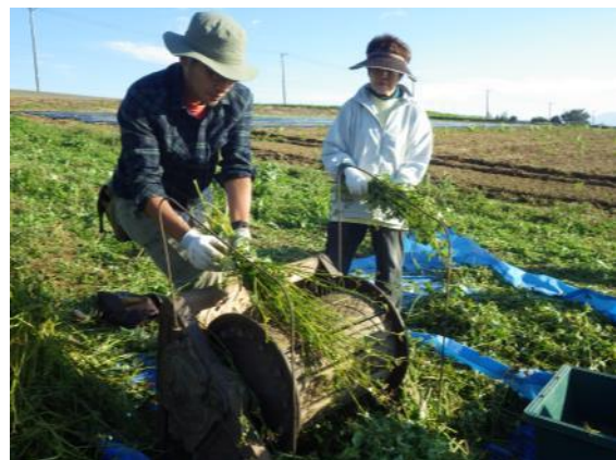
収穫祭での脱穀作業