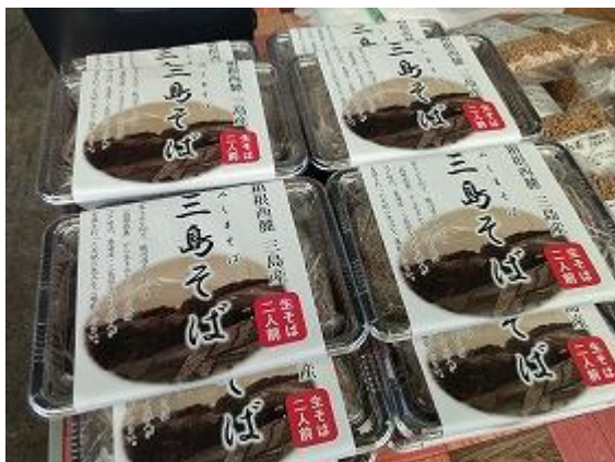
「年越し三島そば」の販売