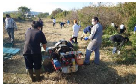
伐採した竹のチップ化作業