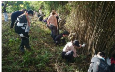
放置竹林の伐採作業