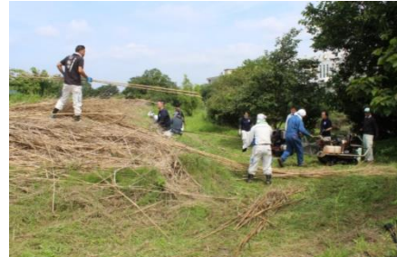
伐採した竹の運搬・チップ化作業