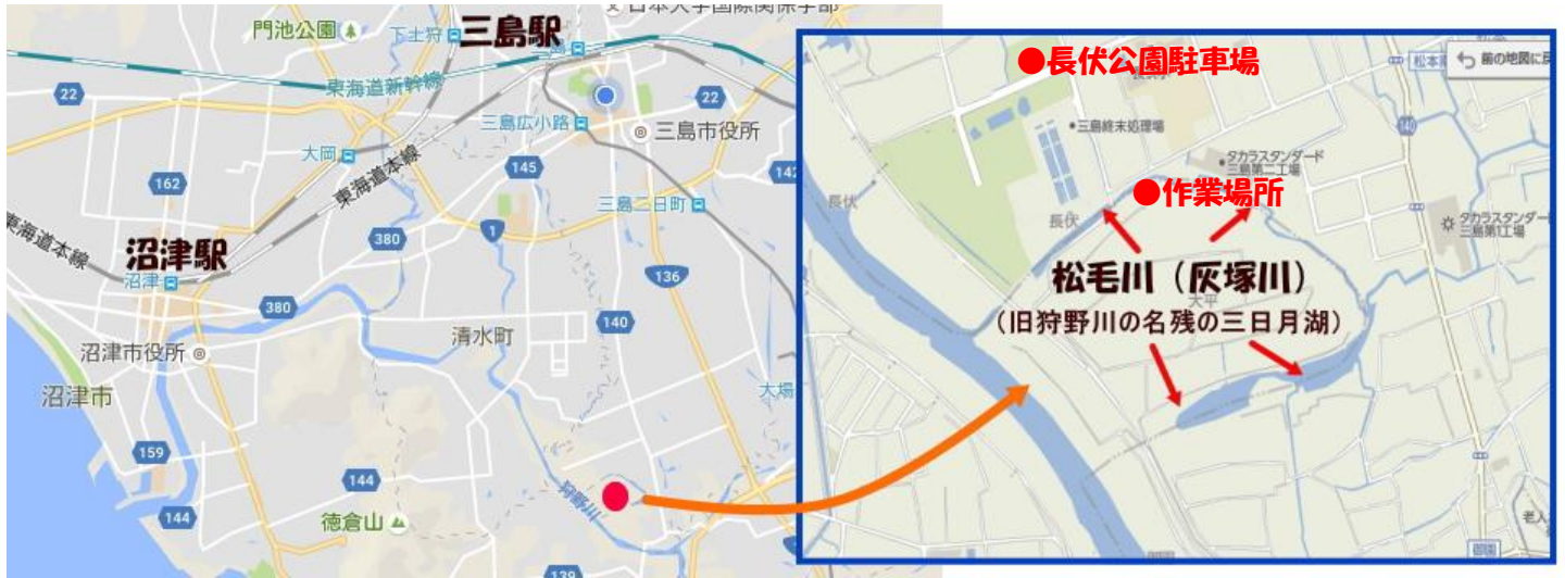
駐車場から作業場所までの徒歩ルート