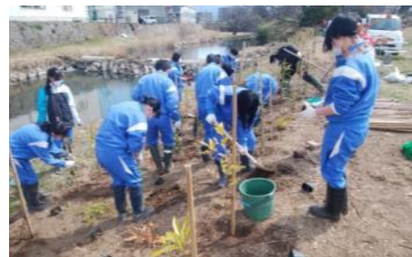
松毛川右岸の植林地