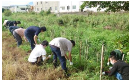
植林地の下草刈り作業