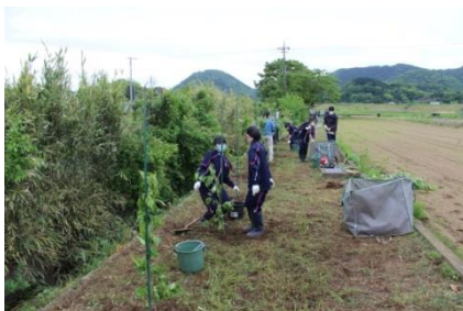
三島桜の植林作業