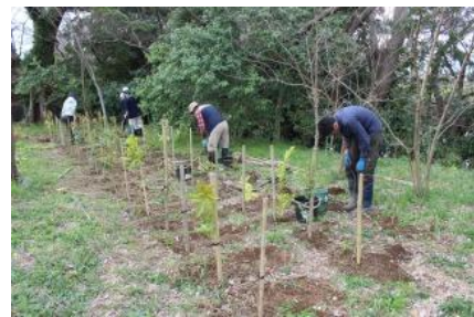
松毛川での植林作業