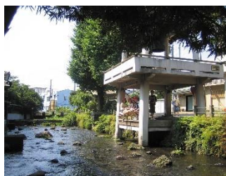
集合場所の三石神社付近