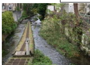
メディカルセンター付近