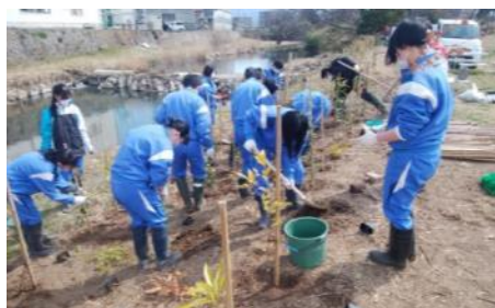
在来種の植林活動