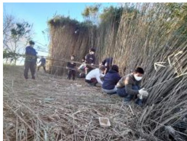
放置竹林伐採作業