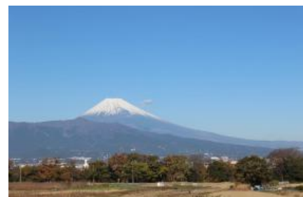
富士山の景観美と河畔林