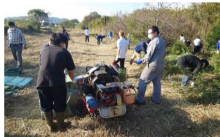
伐採した竹のチップ化作業