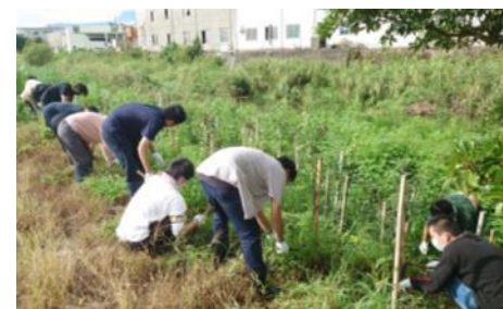
植林地の下草刈り作業