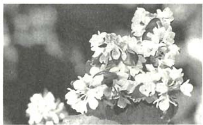
花の下にそばの実が見える

畝のそばの種をまいた。そば畑は西向き斜面で、北に富士山、南に駿河湾を見晴らせる絶景の地。かれんな白い花が風に揺れ、花の下には赤く色づいた実