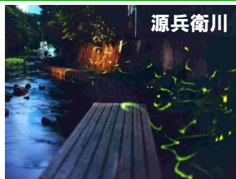
乱舞するゲンジボタル