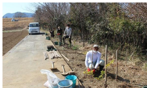
松毛川右岸の植林地