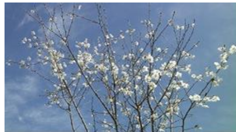
開花した他地区の三島桜