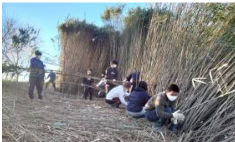
放置竹林伐採作業