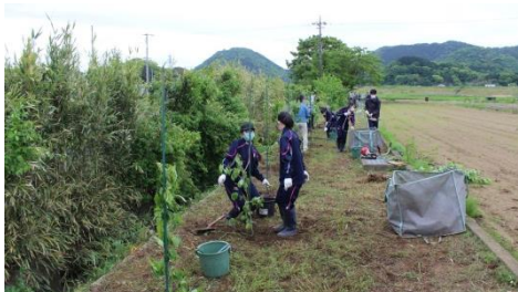
桜の苗木の植樹活動