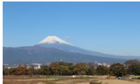
富士山の景観美と河畔林