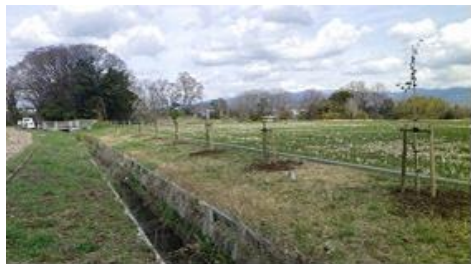
三島桜の里予定地