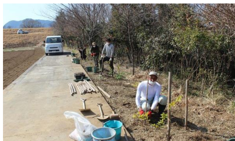
松毛川右岸の植林地