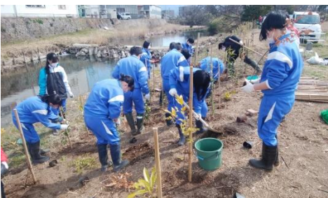
松毛川左岸の植林地