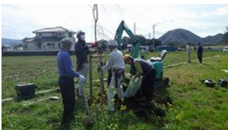
桜の苗木の植樹活動