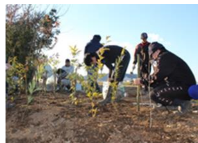
在来種の植林活動

日時： 2022年 2月 26日（土） 10:00～15:00 頃 *小雨決行*