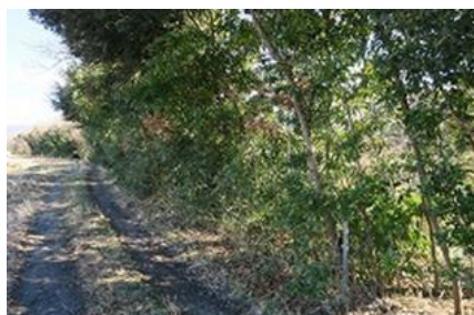
下草が繁茂した河畔林