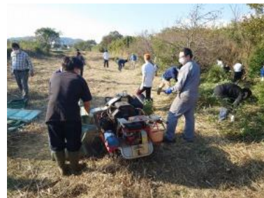
竹のチップ化作業