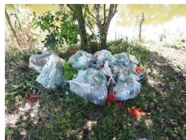
拾い集めたゴミ類