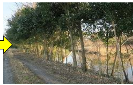
整備された河畔林