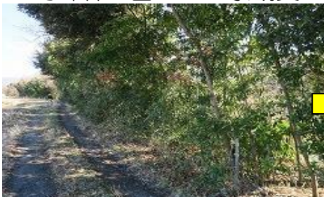
下草が繁茂した河畔林