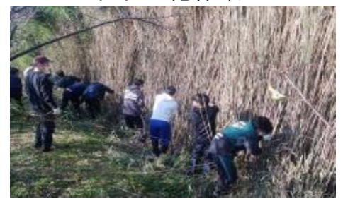
放置竹林の伐採作業