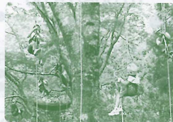
ツリークライミング体験