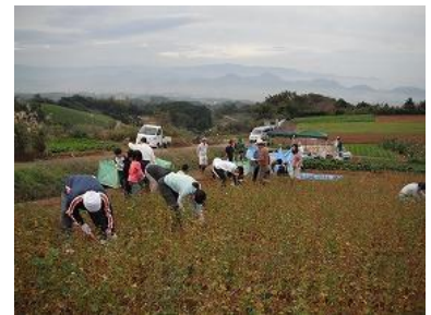
（昨年の収穫・脱穀作業）