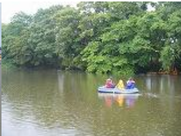
ゴムボートでの観察会