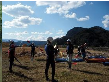
リバーカヤック体験